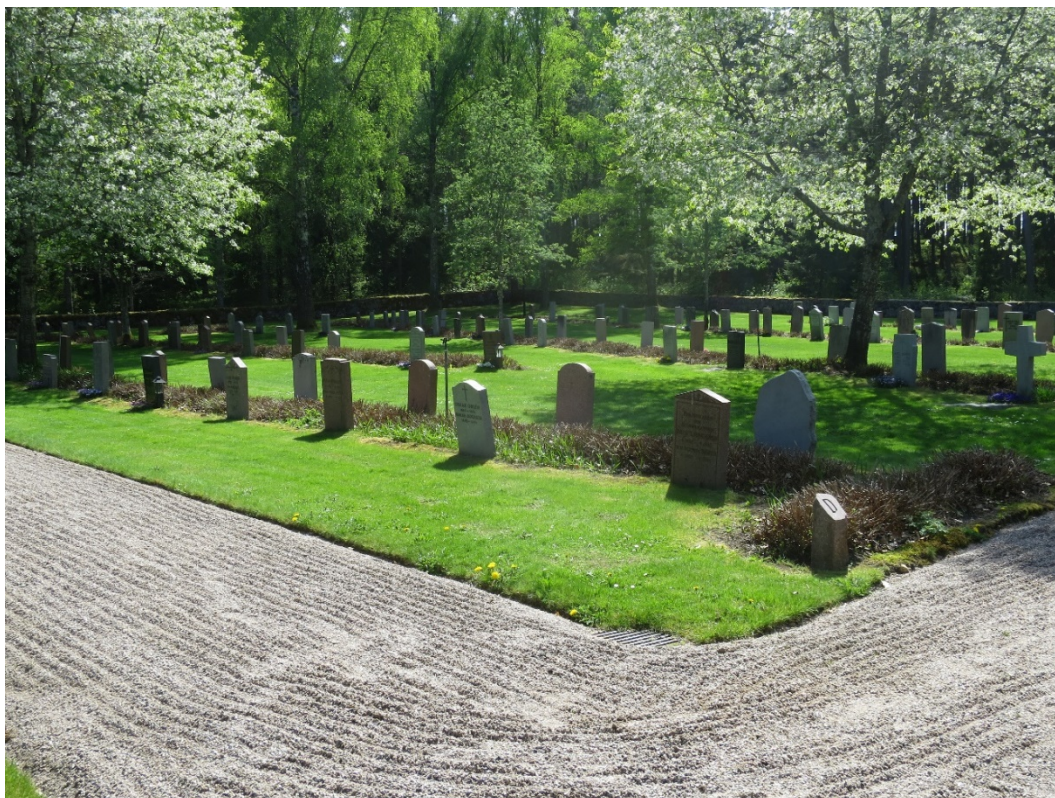
System med krattade grusgångar som finns kvar inom den södra delen är viktigt för den formella karaktären.