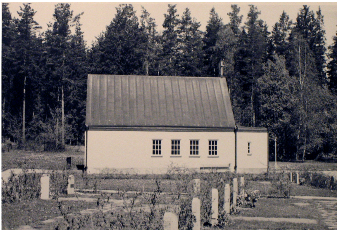
Kapellet och delar av gravytorna i söder omkring 1975. Det allmänna kvarteret närmast kapellet hade nyligen tagits i anspråk. Inom de sydvästra kvarteren fanns kalkstensgångar, vilka numera har avlägsnats. Utmed gravraderna växer häckar av liguster.