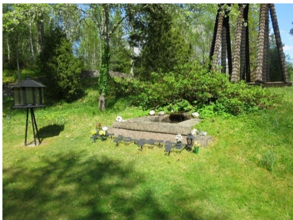
Minneslundan i den norra delen med sin porlande stensatta damm inbäddad i grönska utgör en rofylld plats.

I det sydöstra hörnet finns en ekonomibyggnad med avfallsplats vilken avskärmats visuellt från övriga delar med en numera högvuxen ligusterhäck. Längs den nordsydliga tvärgången finns två skötselplatser, en centralt belägen vid mötet mellan huvudgångarna vilken inhägnas av tuktade idegranshäckar och en i fonden av den södra tvärgången omgärdad av låga buskar av spirea.