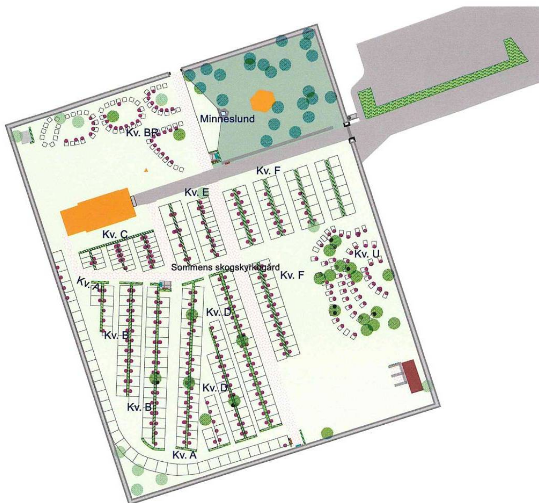
Karta över kyrkogården med kvartersbeteckningar.