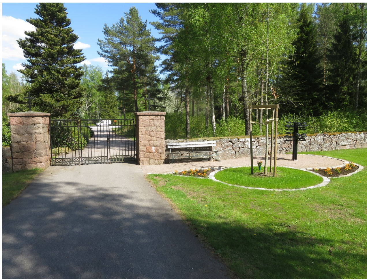
Huvudentrén med sin monumentala grind och den nyligen anlagda askgravlunden.

Målsättning och riktlinjer: Muren bevaras och upprätthålls i gott skick. Skötselmetodik utvecklas. Vid reparationer och partiella omläggningar ska nuvarande uppbyggnad och utseende bibehållas. Stenmaterialet bör återanvändas samt vid behov kompletteras med råkilad lokal granit. Befintlig krönvegetation värnas.