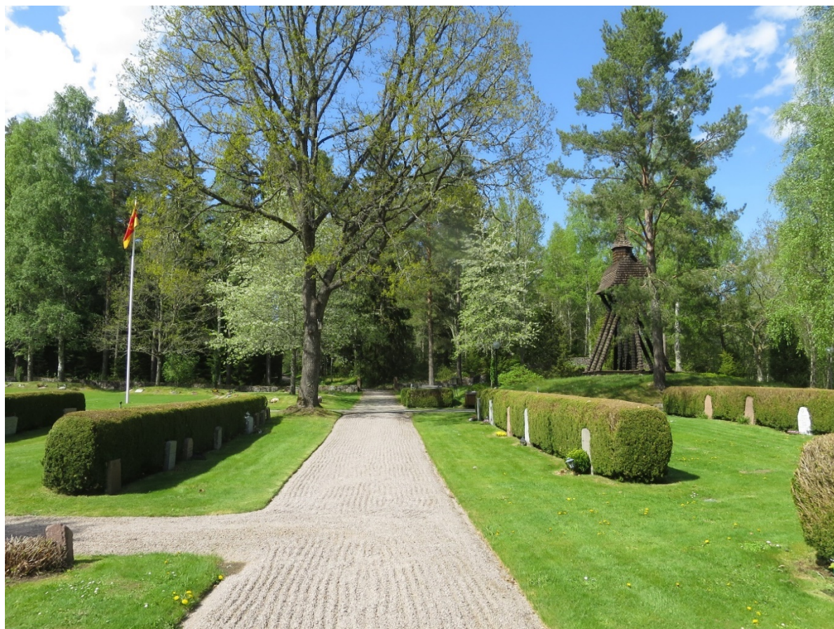
Inom kyrkogården finns både områden med en strikt ordnad utformning och delar där naturen på platsen bevarats. Mellan områdena med skilda karaktärer skapas en effektfull kontrast.

Utmed ringmuren i söder och väster finns kvarter A med några enstaka sentida gravar. I den östra delen finns ett stort område med naturlig löväng som sparats ur. Detta har fått bilda utgångspunkten för det urngravområde som iordningställdes på 2000-talet.