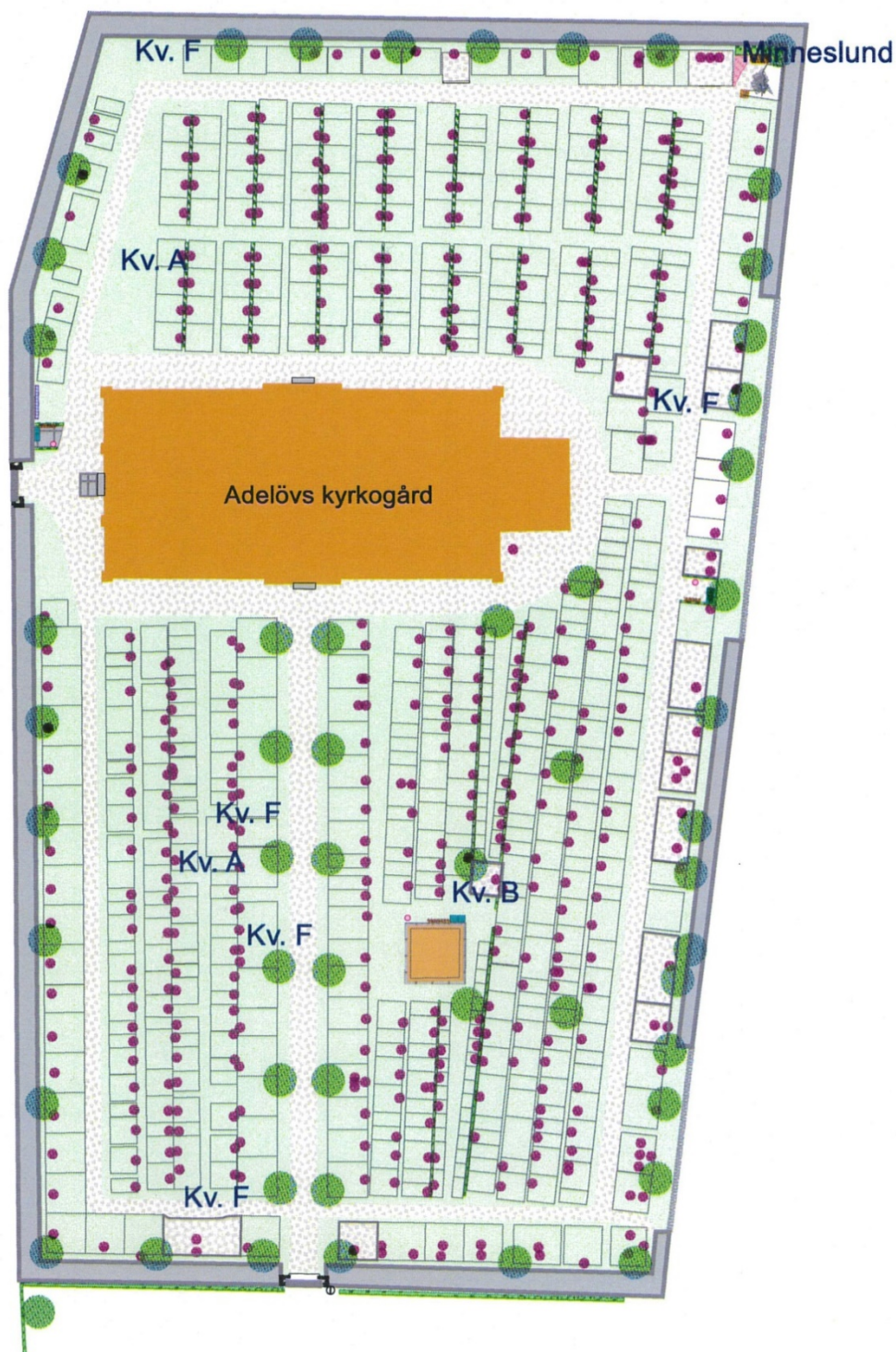
Karta över kyrkogården med kvartersbeteckningar.