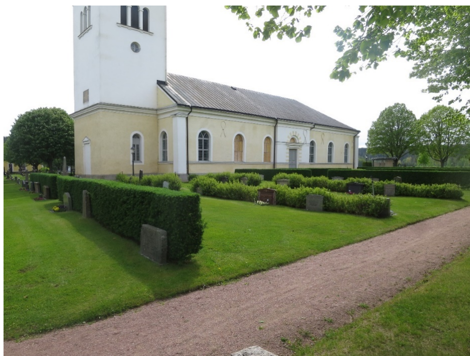
Inre kvarteret norr om kyrkan lades om med dubbla gravrader och rygghäckar i slutet av 1900-talet.

Några äldre vårdar vittnar om föregående tidsskikt och har därmed ett intresse. Vårdarnas låga, tämligen enhetliga karaktär är viktig eftersom kvarteren så tydligt speglar efterkrigstidens ideal.